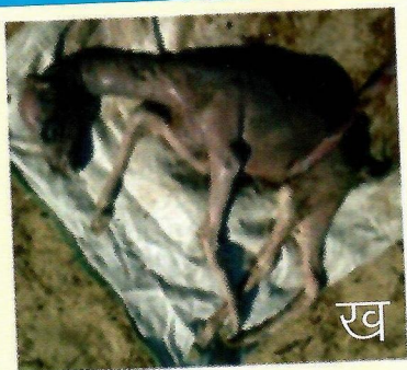
चित्र 1 क. ऊँट के फेफड़े में टी. बी. के लक्षण ख. ब्रुसेल्लोसिस के कारण हुआ गर्भपात

(घ) सिस्टिक हाईडेटिडोसिस : यह एक फीताकृमि के लार्वे से उत्पन्न रोग है। इस फीताकृमि का वयस्क रूप कुत्ते की आंतों में पाया जाता है। कुत्ते के मल में उसके अण्डे निकलते हैं जिसे यदि ऊँट चारे के साथ खा ले तो उसका लार्वा शरीर के विभिन्न अंगों, यथा फेंफड़े, यकृत, तिल्ली और हृदय में विकसित हो जाते हैं। यदि मनुष्य इन अंगों के मांस बिना अच्छी तरह पकाए खा ले तो बीमारी उसमें भी फैल सकती है।