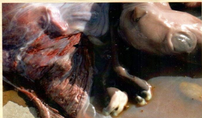
चित्र-1. गर्भपात हुए ऊँट के भ्रूण में चमड़ी के अन्दर व आँखों पर जलभराव के लक्षण तथा प्लेसेन्टा में रक्त का जमाव व सूजन

गर्भपात हुए भ्रूण से दुर्गन्ध आती है तथा पुरे शरीर में सूजन, चमड़ी के भीतर जलभराव, निमोनिया व सभी आंतरिक अंगों व स्थानों में